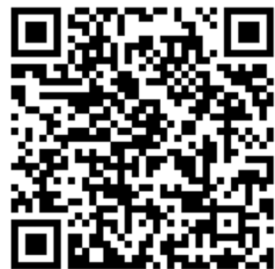
Figuur 4. YouTube filmpje. Jelle Barentsz aan het werk: 'Dit fragment laat zien hoe ik zo'n veertig jaar geleden als radioloog i.o. foto's versloeg: met films, een rollooscoop, papieren EPD op mijn tafel en een bandrecorder om mijn bevindingen uit te typen.'